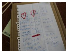
鹿港老街之美食九宮格