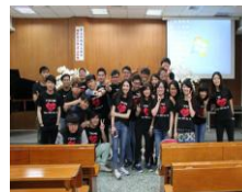
塭仔教會之有怪蜀叔